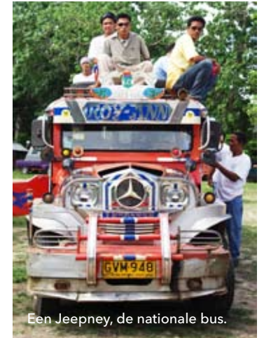
Een Jeepney, de nationale bus.