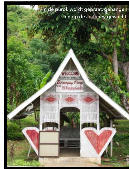
In de purok wordt gepraat, gehangen en op de Jeepney gewacht.

Lees verder op www.livingreisredacteur.nl en breng je stem uit!