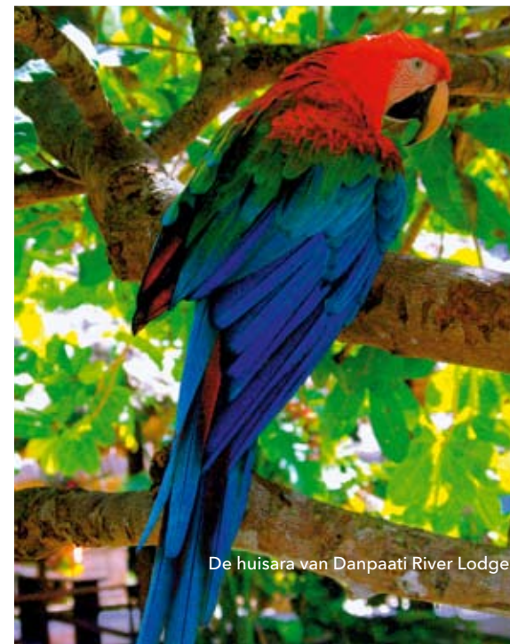
De huisara van Danpaati River Lodge.