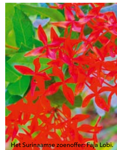
Het Surinaamse zoenoffer: Faja Lobi.