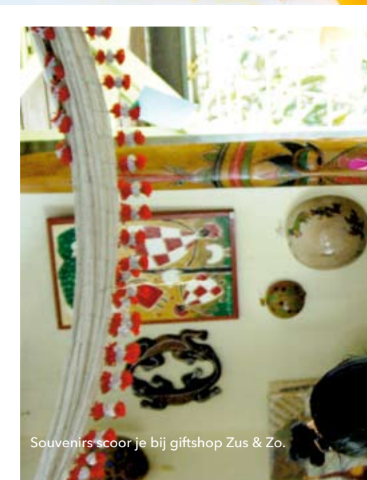
Souvenirs scoor je bij giftshop Zus & Zo.