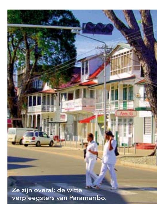
Ze zijn overal: de witte verpleegsters van Paramaribo.