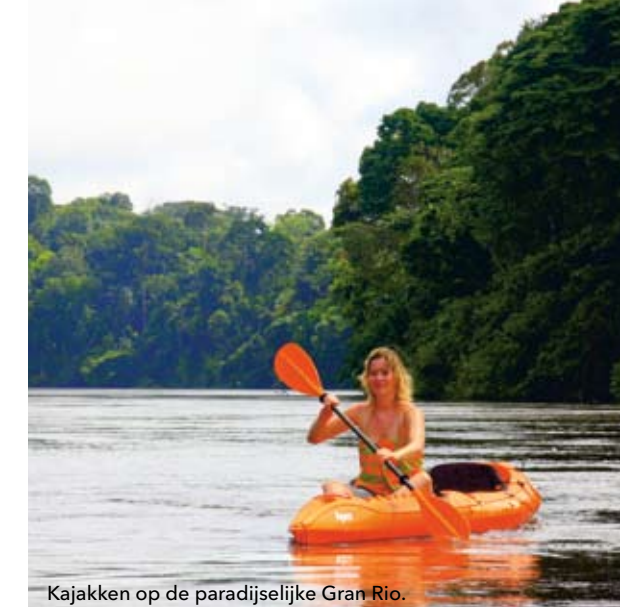
Kajakken op de paradijselijke Gran Rio.