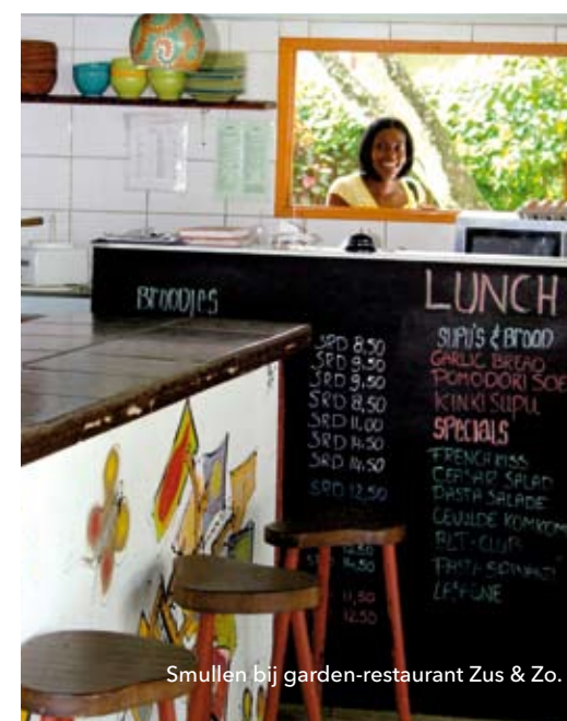
Smullen bij garden-restaurant Zus & Zo.