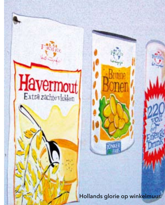
Hollands glorie op winkelmuur.

Vanuit Kajana maken we een tocht over de Gran Rio. Langs de rivier zien we vrouwen de was doen. Door hun fleurige pagni's (omslagdoeken) lijken ze net bloemen tussen het groen. Weelderige bomen, met trotse namen als Purperhart en Bruinhart, buigen zich beschermend over ons heen. Het woud is van zo'n serene schoonheid, dat ik er stil