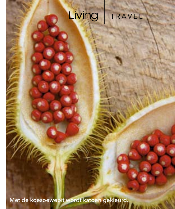
Met de koesoewepit wordt katoen gekleurd.